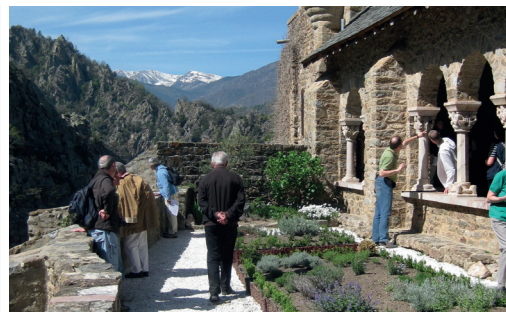
Kunstreise in die französischen Pyrenäen