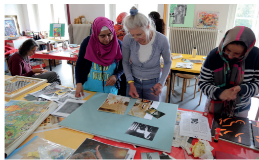
Kreativprojekt zu Beziehungen zwischen orientalischem und europäischem Kunsthandwerk

Um möglichst vielen Menschen in Oldenburg die Begegnung mit dem kulturellen Erbe ihrer Region und der Gegenwartskunst zu sichern, fördern wir folgende Institutionen: