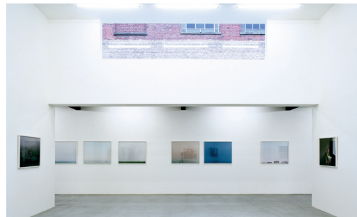
Oldenburger Kunstverein Ausstellungsraum

Der Verein wurde 1992 gegründet und hat u.a. folgende Ziele gesetzt: die Förderung museumspädagogischer Konzepte, die Unterstützung der Kontakte zwischen den Oldenburger Kunst- und Kulturinstitutionen mit Schulen, Kindergärten, der Universität etc. und finanzielle Hilfe bei Aktionen für Jugendliche und Senioren.