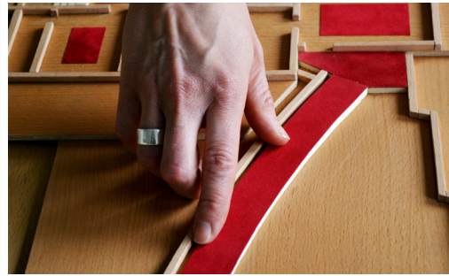
Gefördertes Tastmodell von Grundrissen der Francksen-Villen