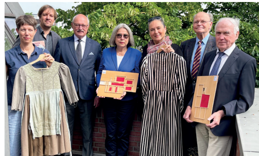
Tastmodelle für Blinde und Kostüme für Gäste der Francksen-Villen

Landesmuseum für Kunst und Kulturgeschichte Stadtmuseum Oldenburg Artothek Oldenburg Edith-Ruß-Haus Oldenburger Kunstverein