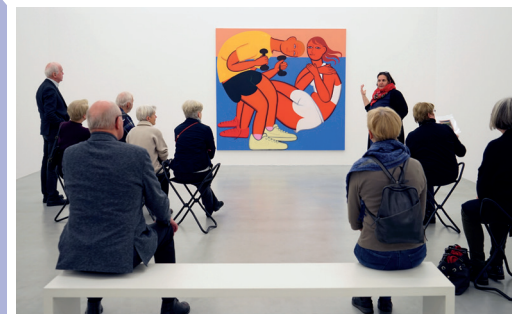
Exklusivführung, hier im Oldenburger Kunstverein